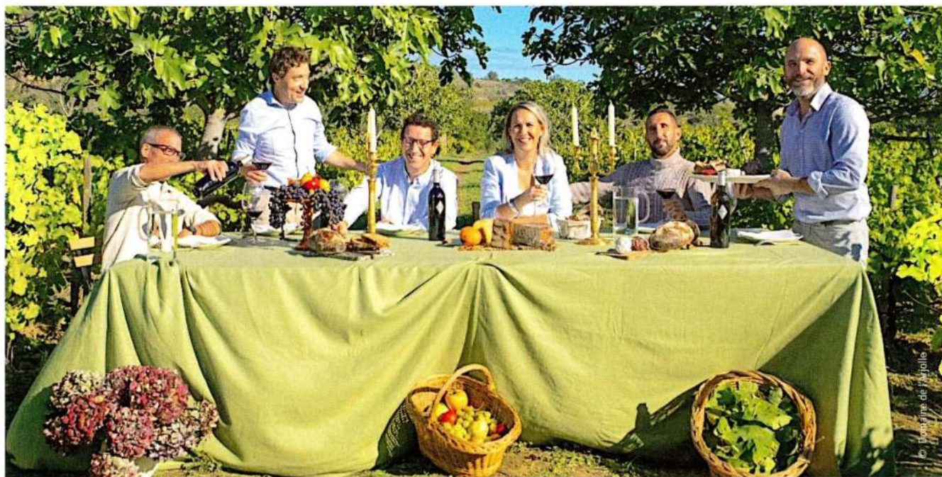
Familiär geht es zu, auf der Domaine de l'Arjolle. Mit großem Erfolg für ihre sieben alkoholfreie Weine